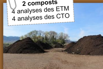
Composts de boues d'industries textiles pas d'épandage en 2021

2 composts 4 analyses des ETM 4 analyses des CTO