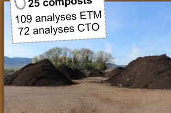
Composts de boues de collectivités

25 composts 109 analyses ETM 72 analyses CTO