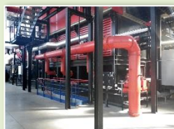
MULHOUSE ILLBERG 2 foyers à grilles - 8 + 4 MW Mise en service en 2014 Arrêté du 07/06/2018 Plan d'épandage 2018