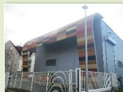
COLMAR – SCCU foyer à grilles – 8 MW Mise en service en 2011 Arrêté du 07/06/2018 Plan d'épandage 2018