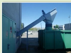
RIXHEIM VALORIM foyer à grilles – 2,8 MW Mise en service en 2010 Arrêté du 12/06/2018 Plan d'épandage 2018

4 PRINCIPALES CHAUFFERIES BIOMASSE (HORS RCUE) DONT UNE PARTIE DE LA PRODUCTION DE CENDRES EST DESTINÉE A L'AGRICULTURE