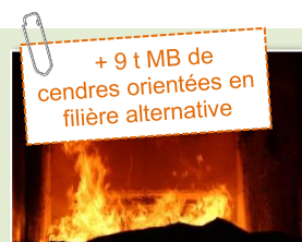
CERNAY ENERGIES ENVIRONNEMENT foyer à grilles – 4,2 MW Mise en service en 2014 Arrêté du 05/11/2020 Plan d'épandage 2020

Fonctionnement saisonnier - Plaquettes forestières